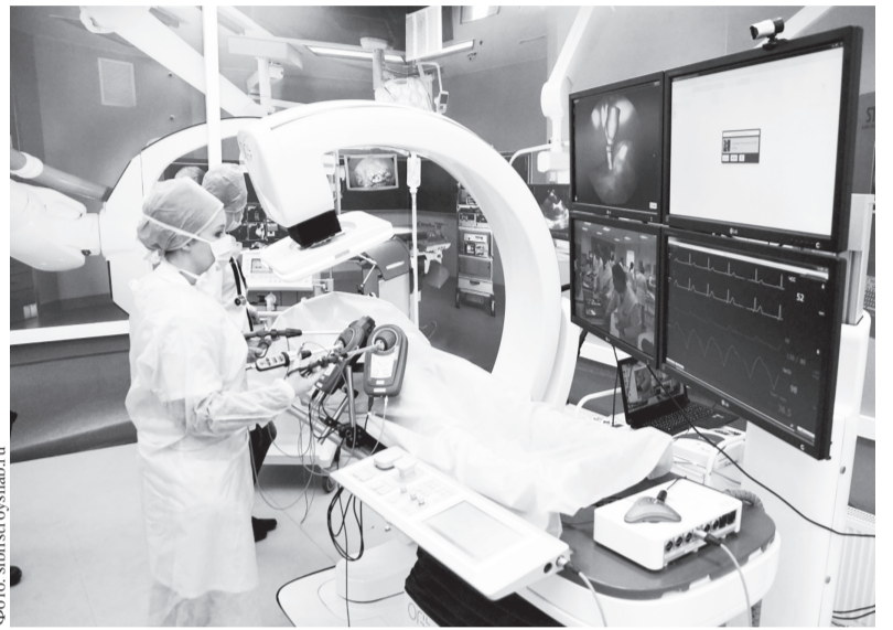
После распределения дополнительных средств общий объем финансового обеспечения реализации госпрограммы «Развитие здравоохранения в Ульяновской области в 2023 году» увеличится на 572 миллиона рублей за счет областного бюджета и на 185 миллионов рублей за счет федерального бюджета, составив 13,8 миллиарда рублей.

На развитие ЖКХ выделено более одного миллиарда рублей. Из них на восстановление прав участников строительства проблемных объектов застройщиков-банкротов